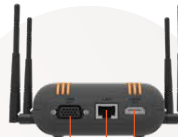
VGA UIT LAN HDMI UIT