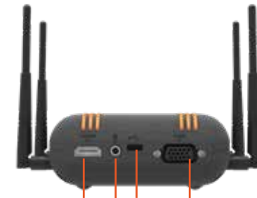
HDMI IN AUDIO IN VGA IN